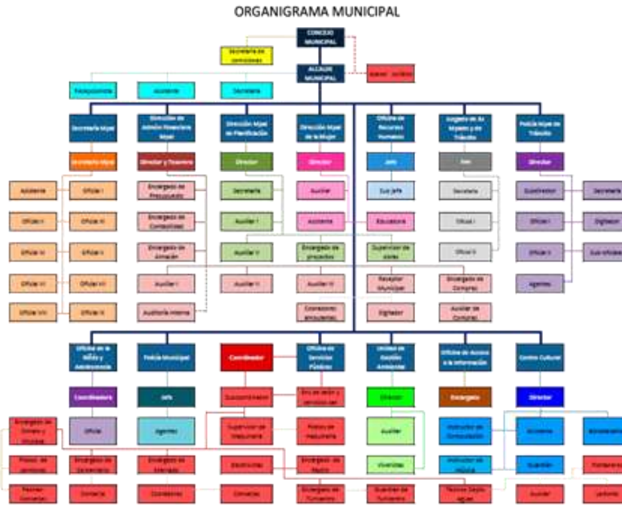
Ilustración 1: Organigrama Municipalidad de Momostenango

La respuesta a las problemáticas priorizadas para atender en el próximo quinquenio no será posible de forma unilateral, sino creando estrategias de coordinación institucional con otros actores con presencia local, sean estos del sector público o privado, organismos locales o internacionales.