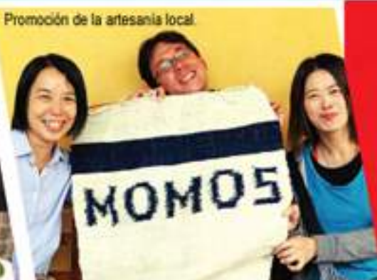
Promoción de la artesanía local.