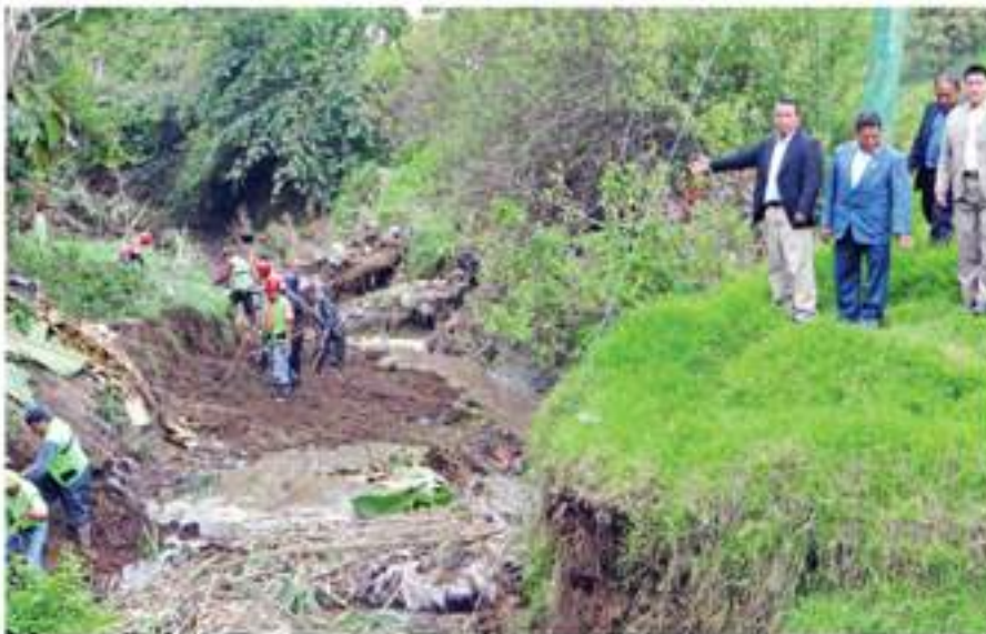
Previo al inicio de la estación de lluvia se realizó el dragado del río Paúl para evitar inundaciones, bajo la dirección del señor Alcalde municipal y la Comisión de Salud.