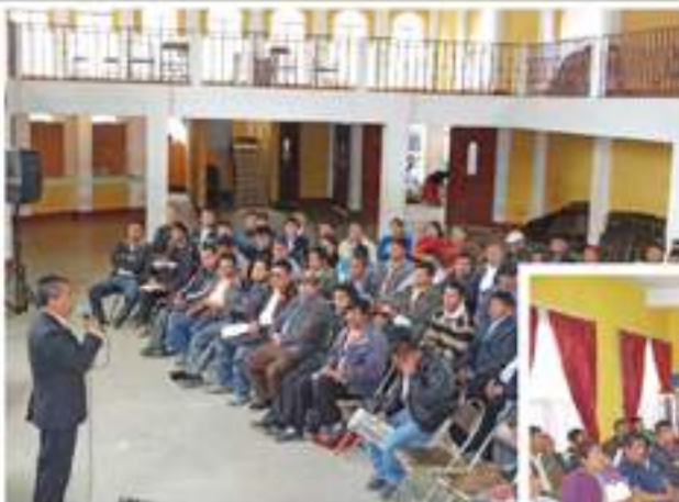
Se realizaron 13 reuniones con el Comude durante el año 2013.

Como parte de la participación ciudadana, las autoridades municipales atendieron tres mil ochocientos ochenta y siete audiencias en el despacho municipal, donde hicieron ver las necesidades básicas que padecen, juntamente hicieron propuestas de solución para las mismas; cabe resaltar que durante el año dos mil trece se celebraron trece sesiones del Comude, donde se priorizaron los proyectos comunitarios para el año dos mil catorce, en dichas reuniones se informó sobre el avance físico de las obras y se discutieron temas de desarrollo municipal, así como la rendición del informe cuatrimestral correspondiente, de los ingresos y egresos de la Municipalidad. Con dichas acciones se evidencia que la Municipalidad es un ente incluyente en la toma de decisiones para el beneficio común.