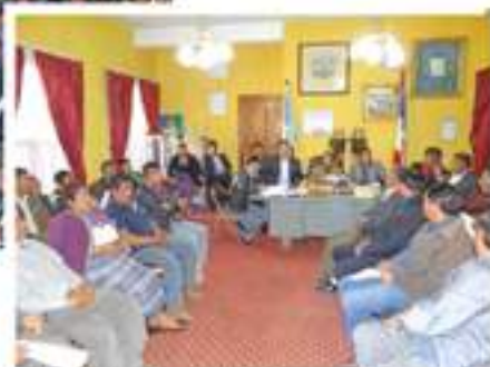
El despacho del señor Alcalde siempre ha estado con puertas abiertas para atender las necesidades que aquejan al vecindario momosteeco y todas las comunidades que la conforman.