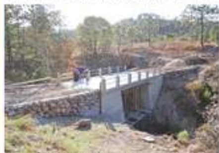
Construcción puente El Elefante, en caserío Jutacaj, comunica a otros parajes del lugar.