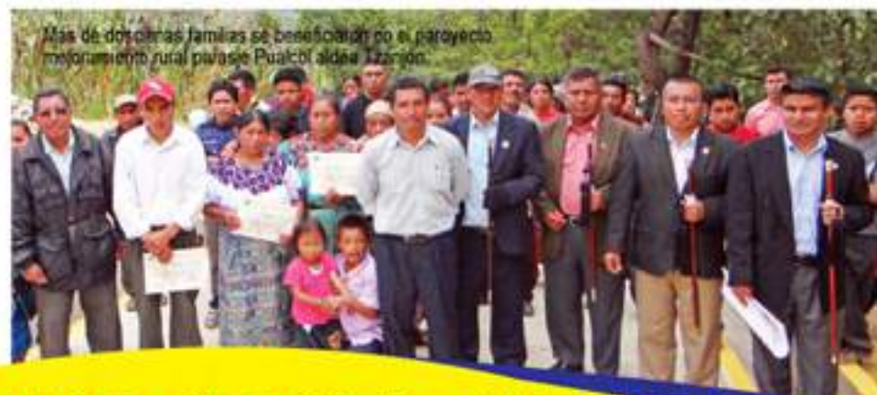
Más de docenas familias se beneficiaron por el proyecto mejoramiento rural parajes Pualcbl aldea Izamón.