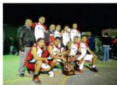
Campeón de baloncesto, Los Dangers masculino, Campeonato navideño 2013.