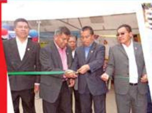
Inauguración de la segunda feria.

E l Director de dicha unidad tiene a su cargo la asesoría a los Comités de los distintos proyectos en la formulación de expedientes, la relación constante ante el Consejo Departamental de Desarrollo informando sobre el avance de las obras para la adjudicación del financiamiento correspondiente, y otras entidades gubernamentales; asimismo desempeña, produce y mantiene actualizado el banco de datos e información necesaria de la realidad, necesidades y expectativas del municipio, como estadísticas socio-económicas, información geográfica, y catastral, inventario permanente de la infraestructura social y preventiva, cobertura de servicios públicos municipales, registro de necesidades prioritizadas y la elaboración del Plan Operativo Anual de la Municipalidad.