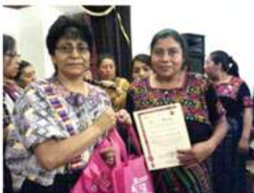
Implementación de la Escuela de Formación Política y Derechos Humanos, 40 mujeres graduadas.