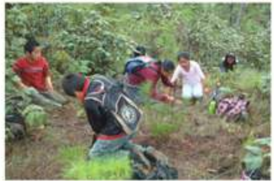
Siembra de árboles en el Monte Pueblo, barrio Santa Ana, con alumnos de diferentes establecimientos.