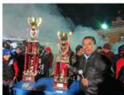
Clausura del campeonato navideño 2013.