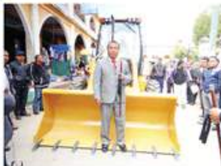
Q660,000.00, costo de la retroexcavadora.