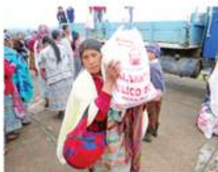
Entrega de bolsas de alimentos a familias de escasos recursos de la aldea Xojajap.