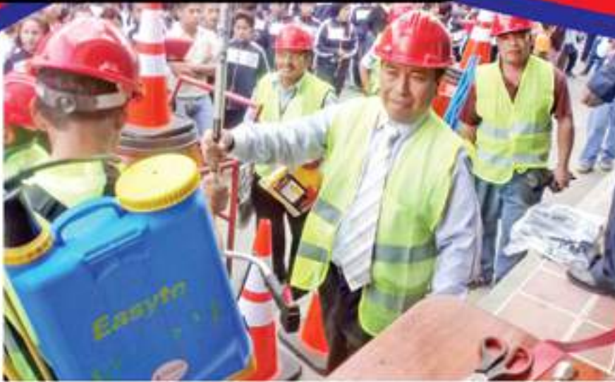
A inicio del año 2013, se crea la comisión de Ornato y Limpieza.