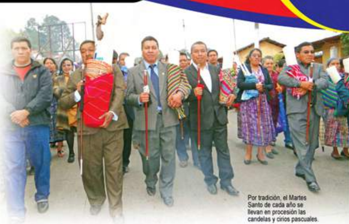
Por tradición, el Martes Santo de cada año se llevan en procesión las candelas y cirios pascuales.

Momostenango se caracteriza por ser uno de los municipios a nivel nacional con una riqueza cultural en aspecto religioso, y la Municipalidad está obligada a apoyar, protegerla, fomentarla y divulgarla a fin de enriquecer lo que nos identifica. Este año la Municipalidad también fomentó el deporte en la niñez y juventud momosteca, muestra de ello es que por primera vez se realizó la Carrera de los 10K, contando para esa ocasión con atletas de talla nacional que son ejemplo para la juventud, para que pueda cultivar este deporte, asimismo se realizaron los campeonatos de Verano y Navideño en las ramas femenina y masculina en las disciplinas papifutbol, mamifutbol y baloncesto.