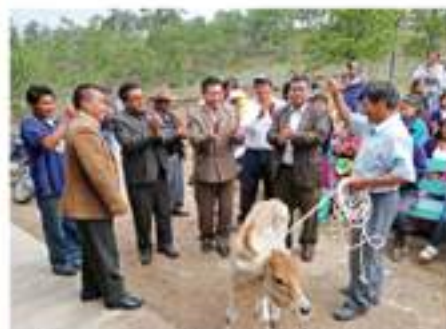
Entrega de vobinos a los vecinos del caserío Panca.