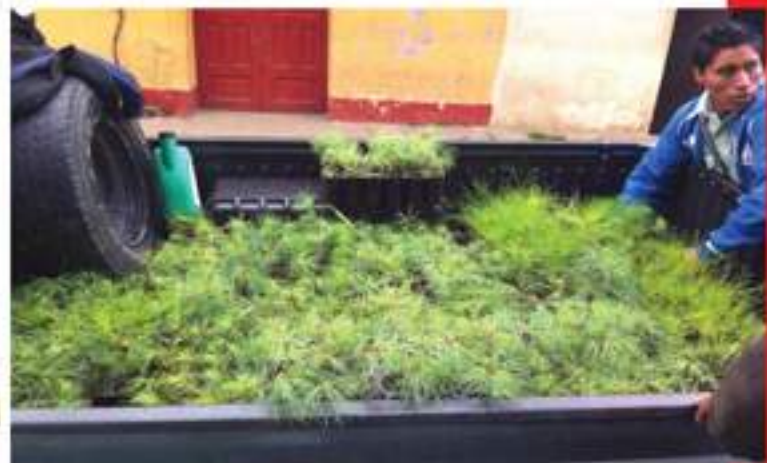
Se realizó la entrega de árboles a autoridades comunitarias de la aldea Santa Ana.