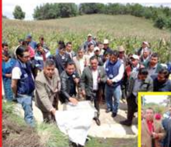
Mejoramiento camino rural Paraje Xecruz, aldea Santa Ana.