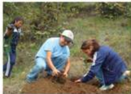
Personal de UGAM hace demostración para la siembra de árboles.