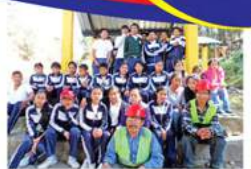
Personal de Ornato y Limpieza, realiza actividades de higiene en las calles y avenidas del municipio con alumnos del INEB.