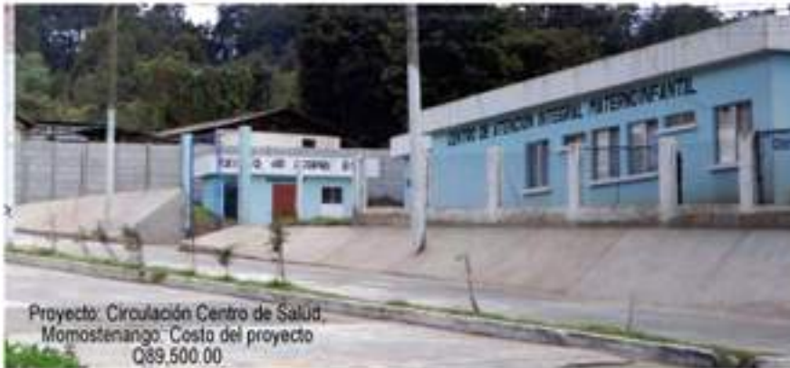
Proyecto: Circulación Centro de Salud, Momostenango. Costo del proyecto Q89,500.00