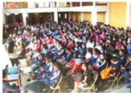
Capacitación a alumnos de la Escuela Oficial Rural Mixta, Santa Isabel, previo a la reforestación del Monte Pueblo.

Dentro del entorno de sobrevivencia del ser humano esta la importancia de cuidar nuestro habitat, es por ello que la Municipalidad a participado de forma activa para reforestar los lugares necesario y vitales para sembrar árboles para nuestro futuro y así ser parte responsable del aire sano que respiramos. Dependencias Municipales realizaron varios eventos en el 2013 con el objetivo de insertar dentro de esta gran responsabilidad a todos los alumnos de diferentes Escuelas para que también tengan la conciencia ecológica.