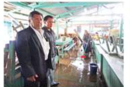
La Comisión de Abastos promovió la limpieza general interior del mercado municipal.