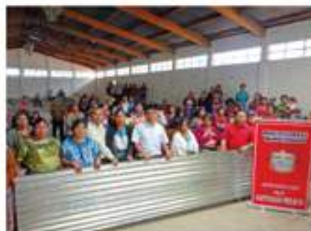
Entrega de laminas a familias de escasos recursos del paraje, Patuneya de la aldea Tzanjón.