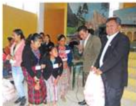
Ayuda a minusválidos.

Bolsas de alimento: como parte del compromiso de responsabilidad social para atender a la población de bajos recursos económicos del municipio, se hizo la entrega de 4,342 bolsas de alimentos que se componen de maíz blanco, arroz blanco, frijol negro, atol a base de harina de maíz y harina de soya fortificada, aceite vegetal de 500 ml, granos básicos que conforman la dieta alimenticia de la población, con un costo de Q799,500.00 (setecientos noventa y nueve mil quinientos quetzales exactos).