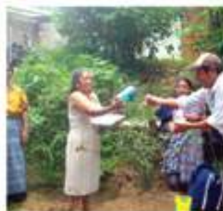
Capacitando a las familias en la implementación de huertos familiares.