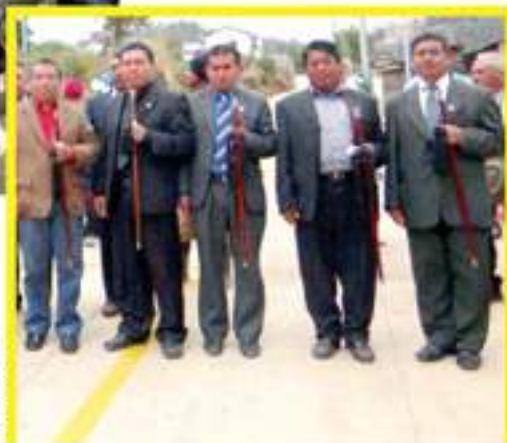
El 21 de abril se inauguro del proyecto de Pavimentación de la Primera Avenida, Centro Sur, aldea San Vicente Buenabaj