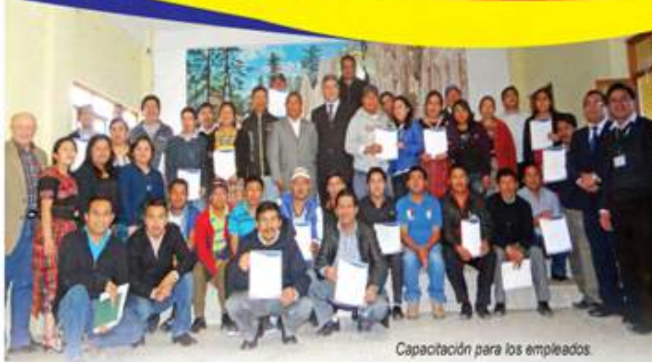
Capacitación para los empleados.