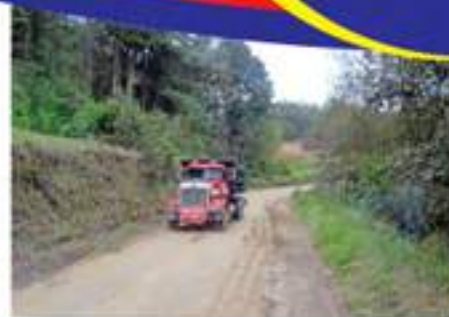
Arrendamiento de vehículos para acarreo de balastro para el mejoramiento de los caminos rurales.