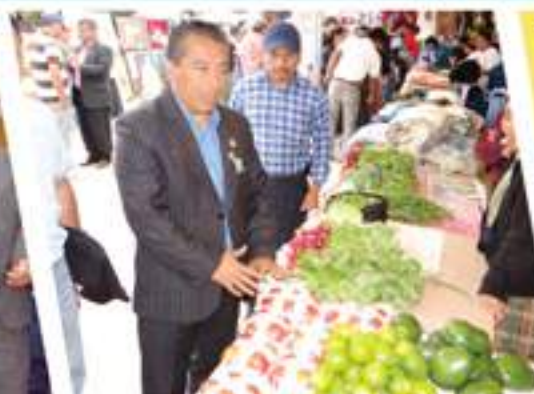
Autoridades municipales recorren la feria artesanal.