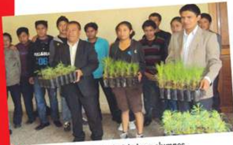
Se realizó la entrega de árboles a alumnos de diferentes establecimientos educativos.