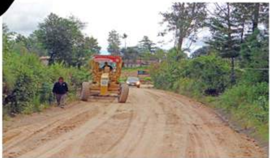
Vehículo municipal trabajando para el mejoramiento de la carretera de la aldea Santa Ana.

RENOVACIÓN DE FLOTA VEHICULAR: Se adquirieron tres vehículos nuevos: un camión, un picop, una retroexcavadora, con lo que se eleva a cuatro el total de equipos nuevos que el Gobierno Municipal ha adquirido durante su gestión. La inversión de la nueva flota fue de Q947,526.00 (novecientos cuarenta y siete mil quinientos veintiséis quetzales exactos), con lo cual se ha propiciado más eficiencia y rapidez en la prestación de servicios para los ciudadanos y ciudadanas del municipio. Es oportuno hacer ver que una de las prioridades de la actual administración es procurar que el estado de las carreteras se mantenga en óptimas condiciones, así como la construcción de caminos de acceso dentro de la circunscripción municipal.