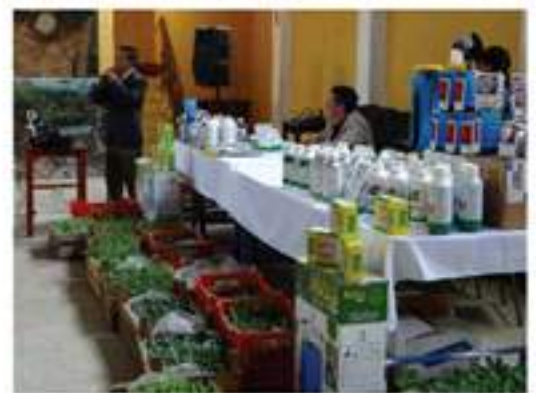
Entrega de insumos y pilones a las mujeres beneficiadas.