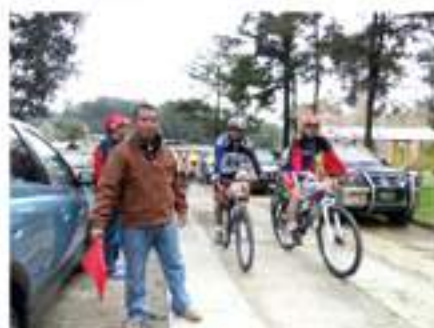
Ayorando la travesía en bicicleta 2013