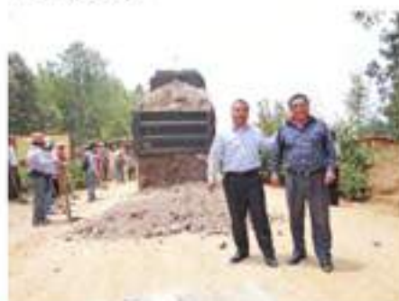
Autoridades municipales entregan balastro para el mejoramiento del camino rural caserío Chonimatux.