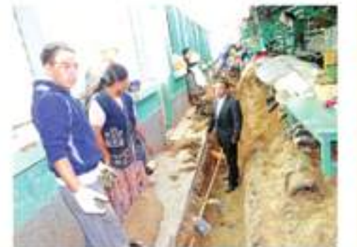
Mejoramiento del sistema de drenaje, interior del Mercado Municipal No. 1.