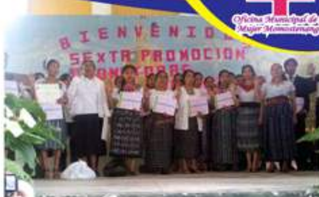
Implementación del diplomado de voluntarias en salud rural, 35 mujeres y hombres graduados.