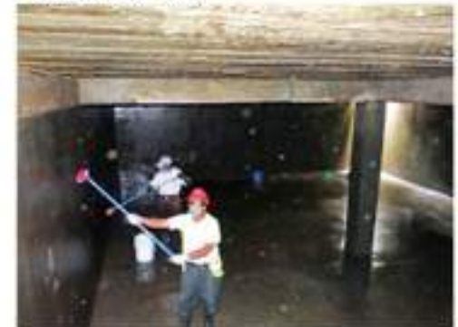
El saneamiento de los tanques públicos municipales es necesario para salud.