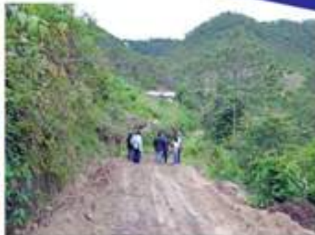
Apertura de una nueva carretera que comunica la aldea Patulup con el caserío Chojunacruz.