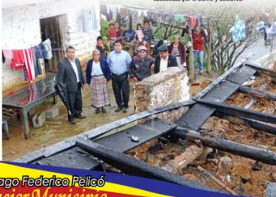
Apoyo a la reconstrucción de viviendas causadas por el sismo y deslaves.